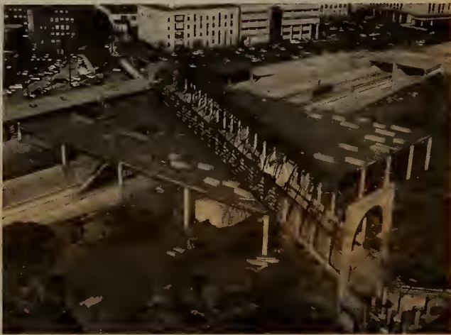
Recent view of Ruggles St. Station, showing main entrance, trackway and bus ramps with Northeastern University in the background.

El Contrato 097-116 (Modern Continental Construction Company), estación de Back Bay, está más de medio terminada. El acero estructural para la bóveda acústica entre las calles Clarendon y Berkeley está erigido. Los paneles